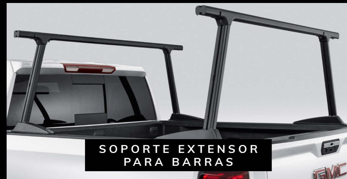
SOPORTE EXTENSOR PARA BARRAS