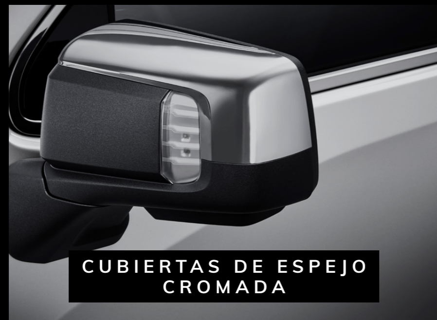
CUBIERTAS DE ESPEJO CROMADA