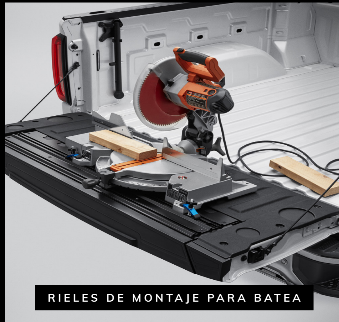
RIELES DE MONTAJE PARA BATEA