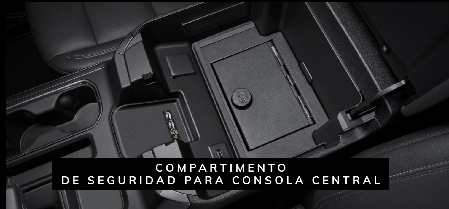
COMPARTIMENTO DE SEGURIDAD PARA CONSOLA CENTRAL