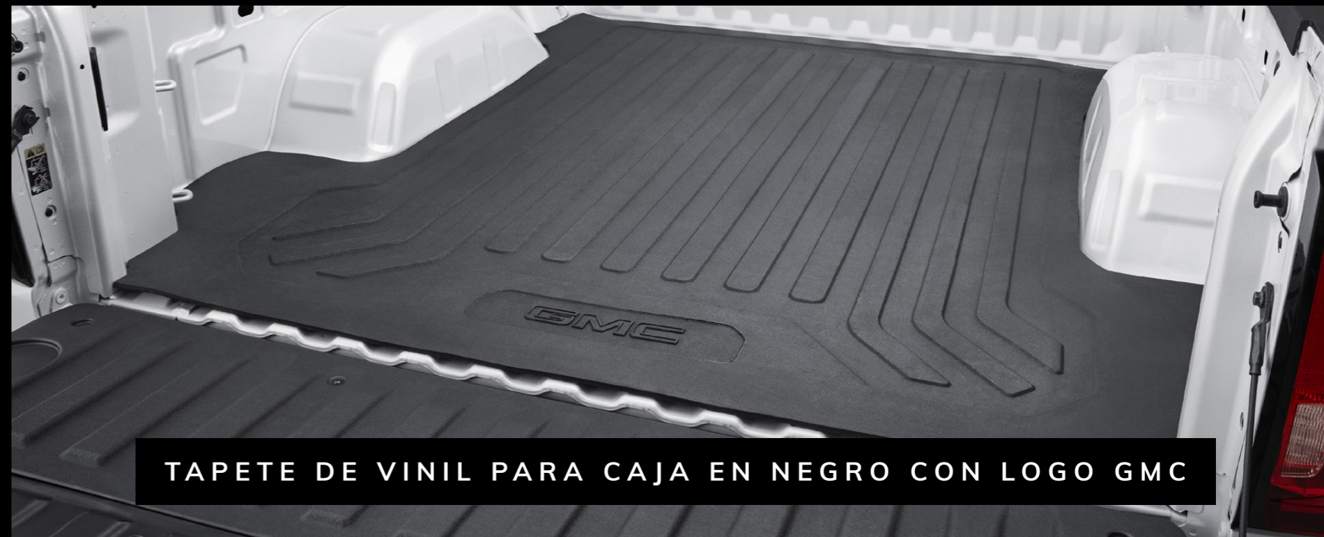
TAPETE DE VINIL PARA CAJA EN NEGRO CON LOGO GMC