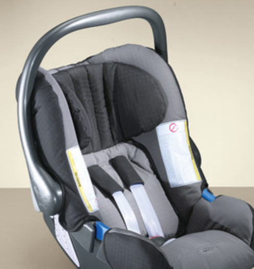
SILLA PARA BEBÉ