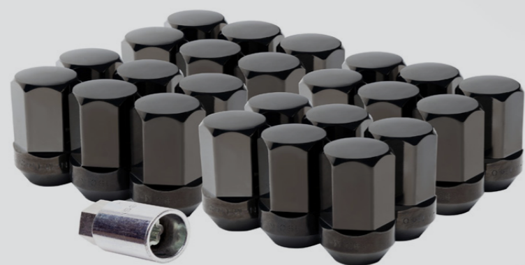
BIRLOS DE SEGURIDAD COLOR NEGRO