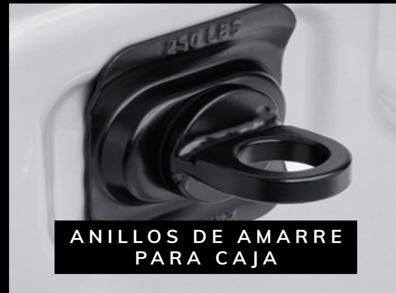
ANILLOS DE AMARRE PARA CAJA