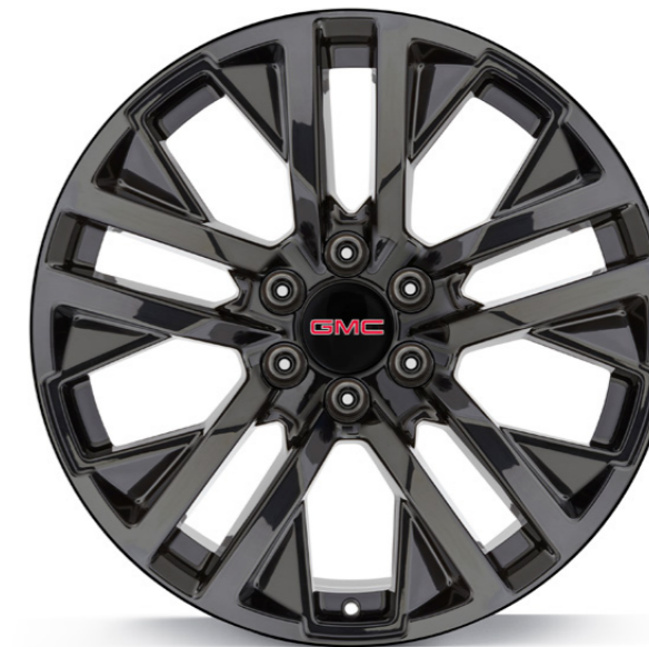
RIN DE ALUMINIO 22" EN NEGRO BRILLANTE DE 5 BRAZOS DIVIDIDOS