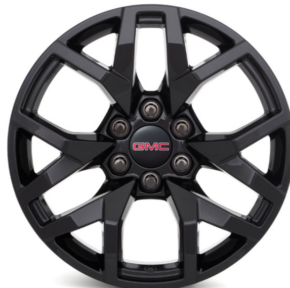
RIN DE ALUMINIO DE 20" EN NEGRO BRILLANTE DE 6 BRAZOS DIVIDIDOS