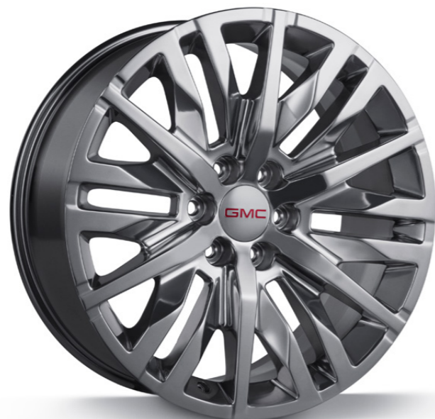
RIN DE ALUMINIO 22" EN ACABADO PULIDO DE MÚLTIPLES BRAZOS