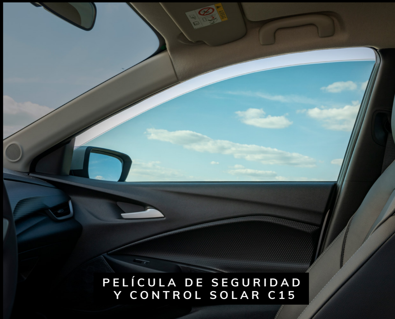
PELÍCULA DE SEGURIDAD Y CONTROL SOLAR C15