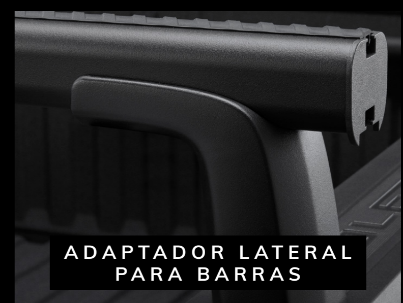
ADAPTADOR LATERAL PARA BARRAS