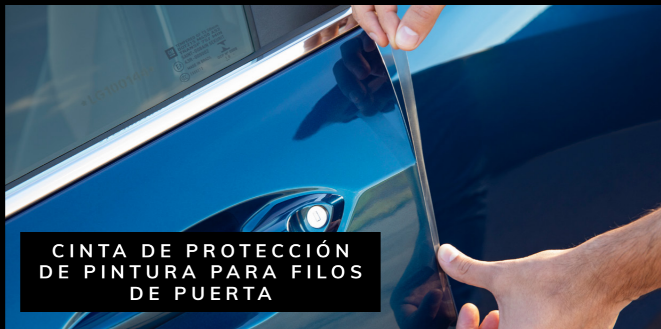
CINTA DE PROTECCIÓN DE PINTURA PARA FILOS DE PUERTA