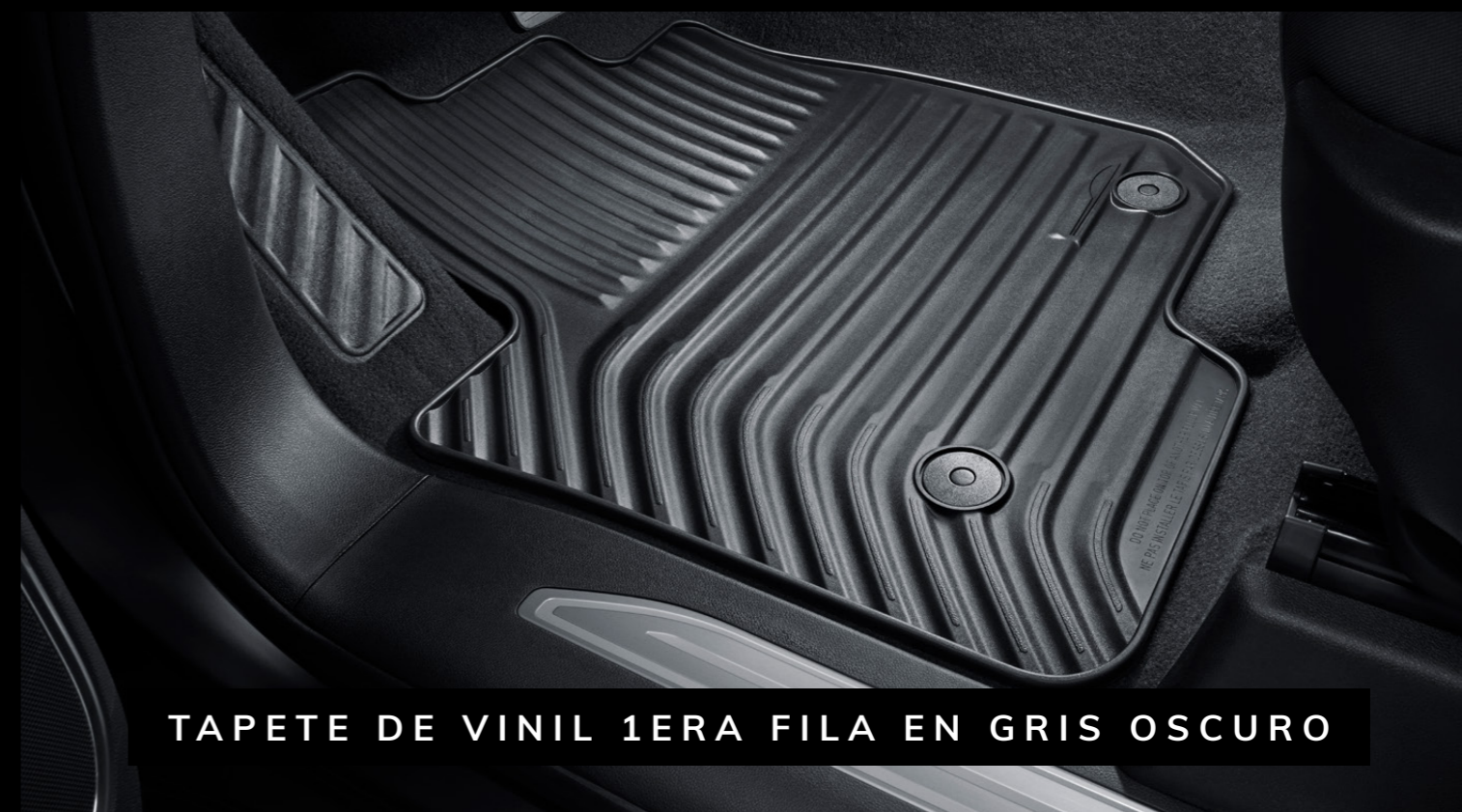
TAPETE DE VINIL 1ERA FILA EN GRIS OSCURO