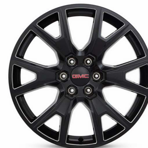
RIN DE ALUMINIO 22" EN NEGRO METÁLICO CON MECANIZADO DE 6 BRAZOS DIVIDIDOS