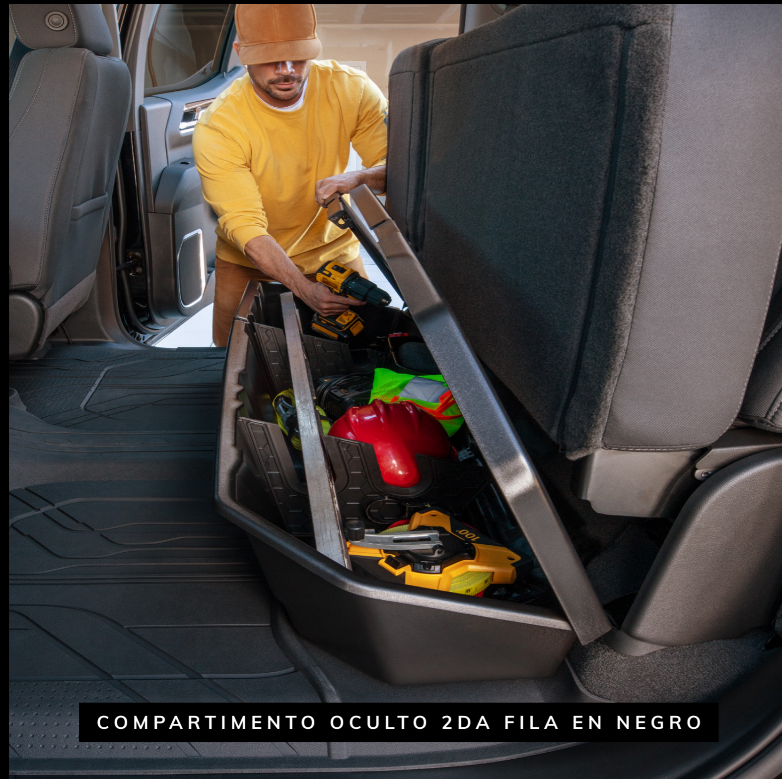
COMPARTIMENTO OCULTO 2DA FILA EN NEGRO