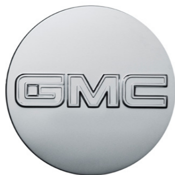
CENTRO DE RIN CROMADO