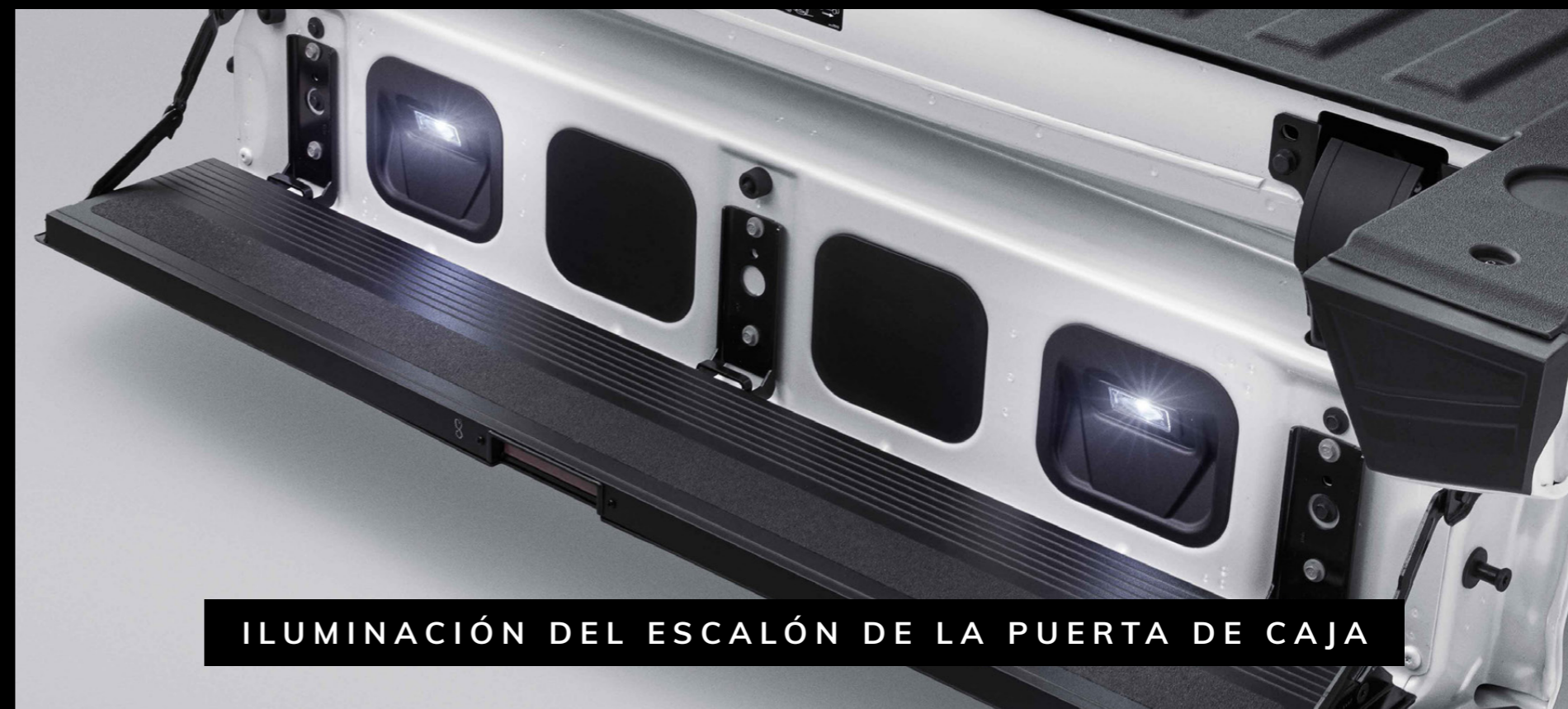
ILUMINACIÓN DEL ESCALÓN DE LA PUERTA DE CAJA