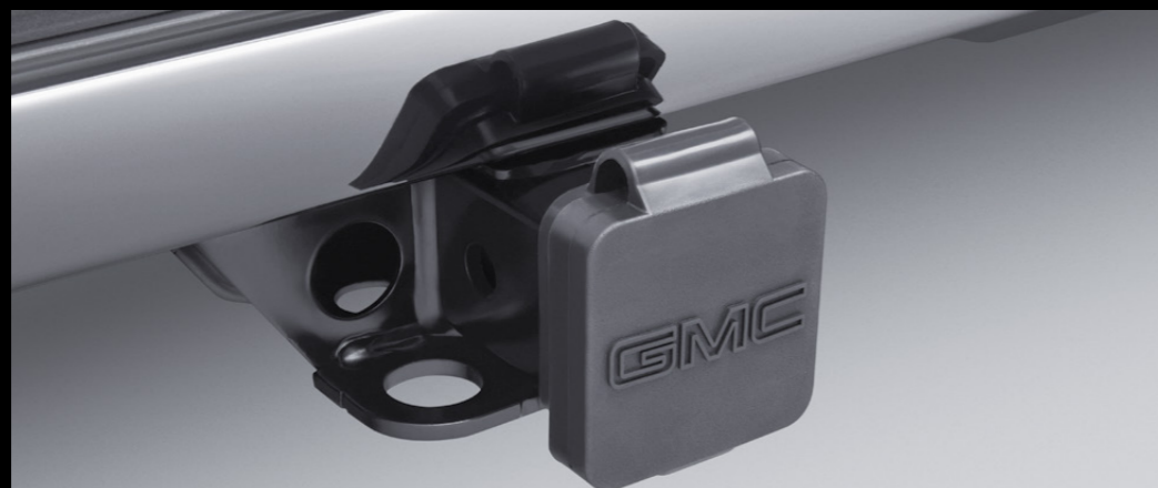
CUBIERTA DE ENTRADA DE SISTEMA DE ARRASTRE EN NEGRO