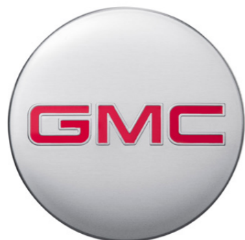
CENTRO DE RIN DE ALUMINIO BRILLANTE