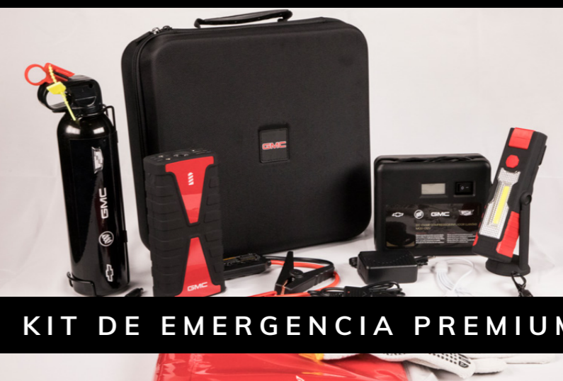
KIT DE EMERGENCIA PREMIUM