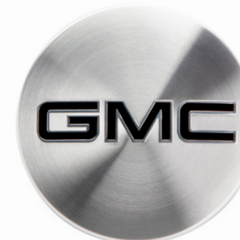
CENTRO DE RIN EN ALUMINIO CEPILLADO