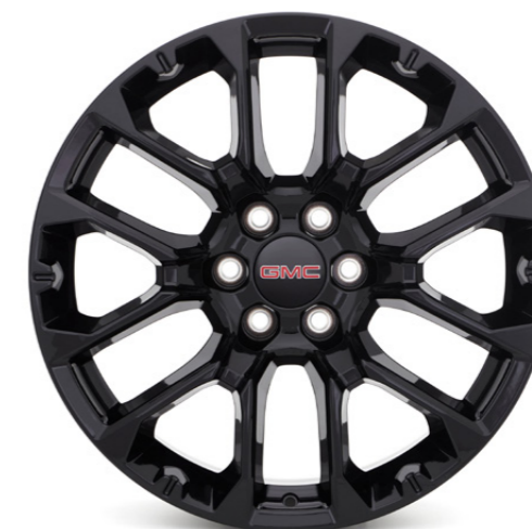
RIN DE ALUMINIO 22" EN NEGRO BRILLANTE DE 6 BRAZOS DIVIDIDOS