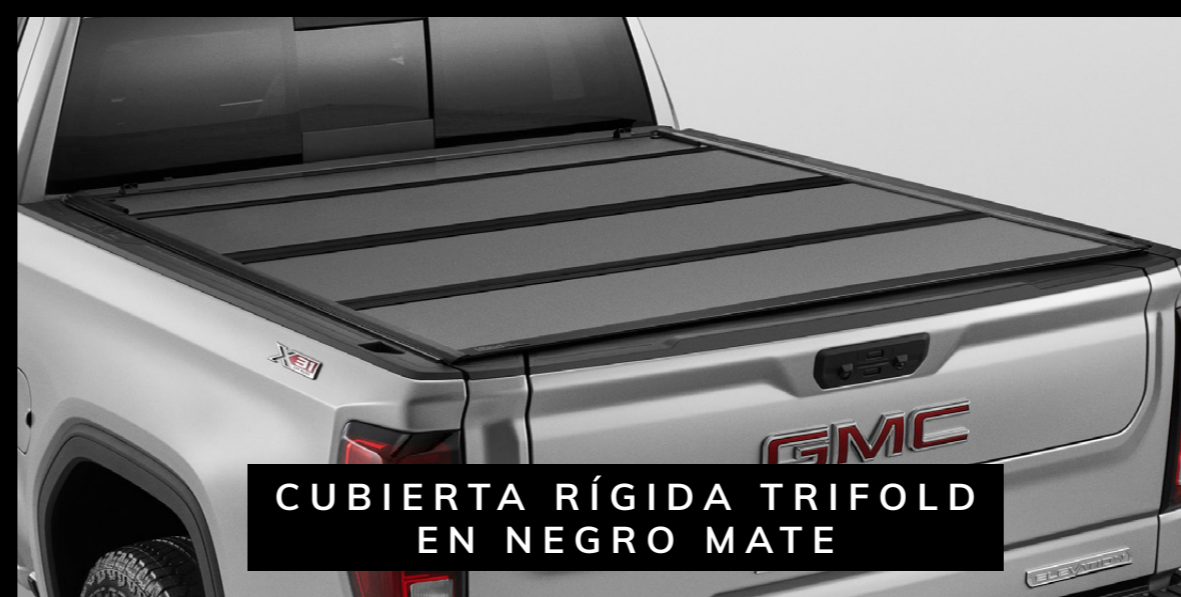
CUBIERTA RÍGIDA TRIFOLD EN NEGRO MATE