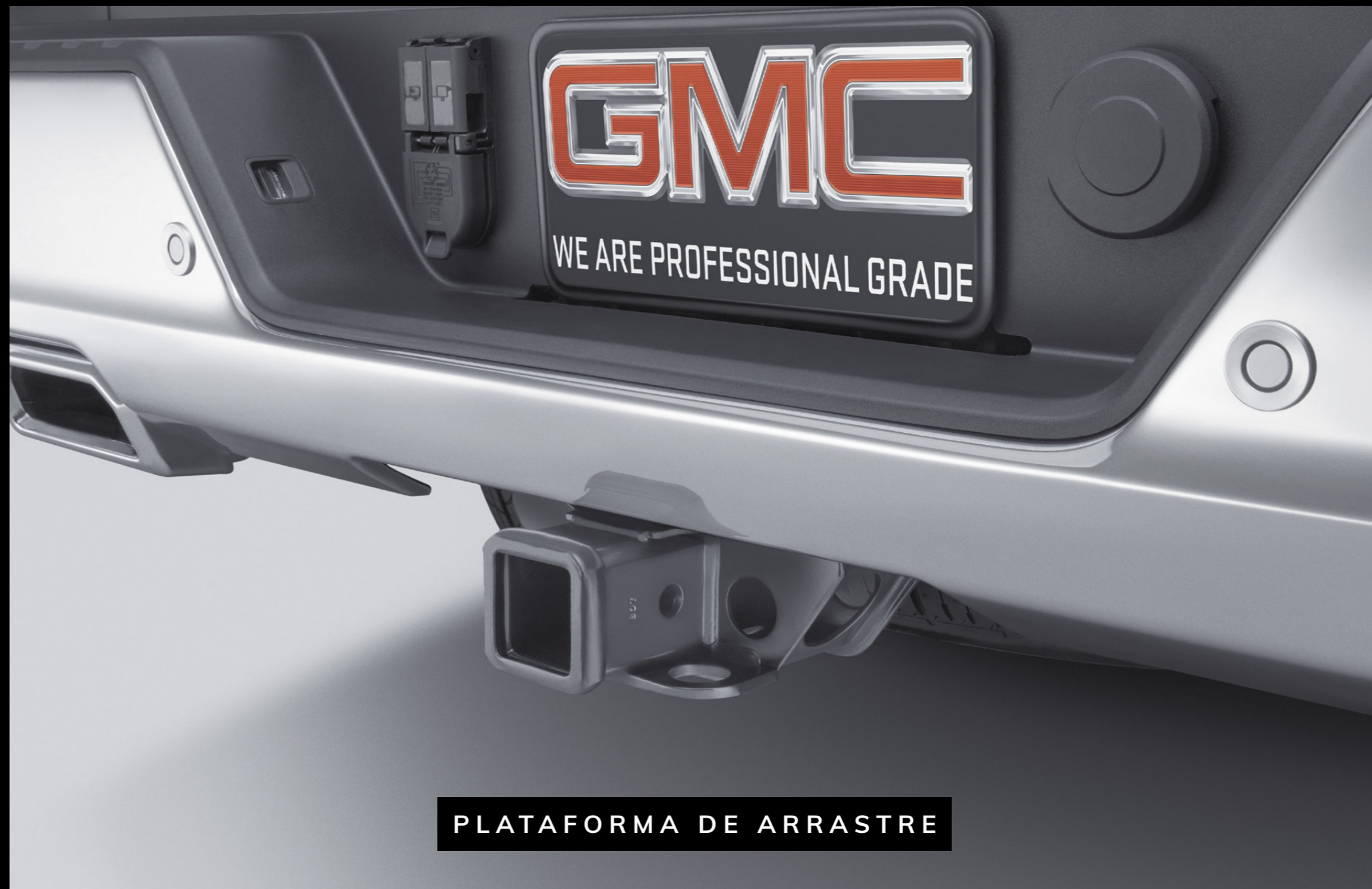
PLATAFORMA DE ARRASTRE