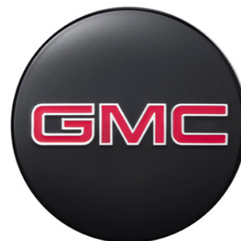
CENTRO DE RIN EN NEGRO