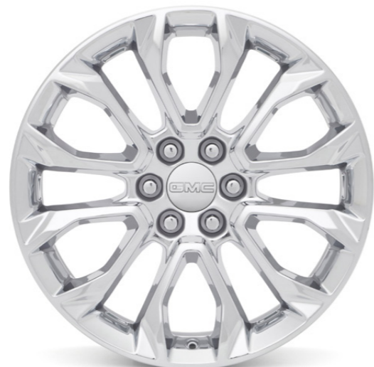
RIN DE ALUMINIO 22" CROMADO DE 6 BRAZOS DIVIDIDOS