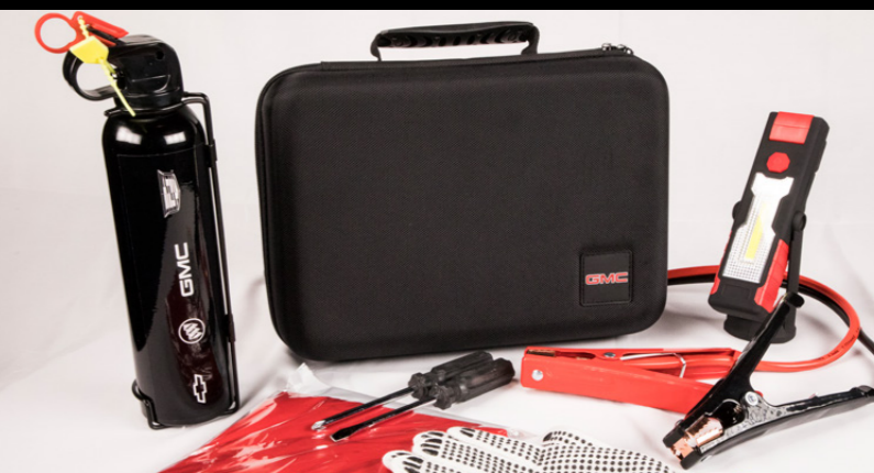
KIT DE EMERGENCIA BÁSICO