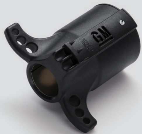
ADAPTADOR PARA ARNÉS DE REMOLQUE