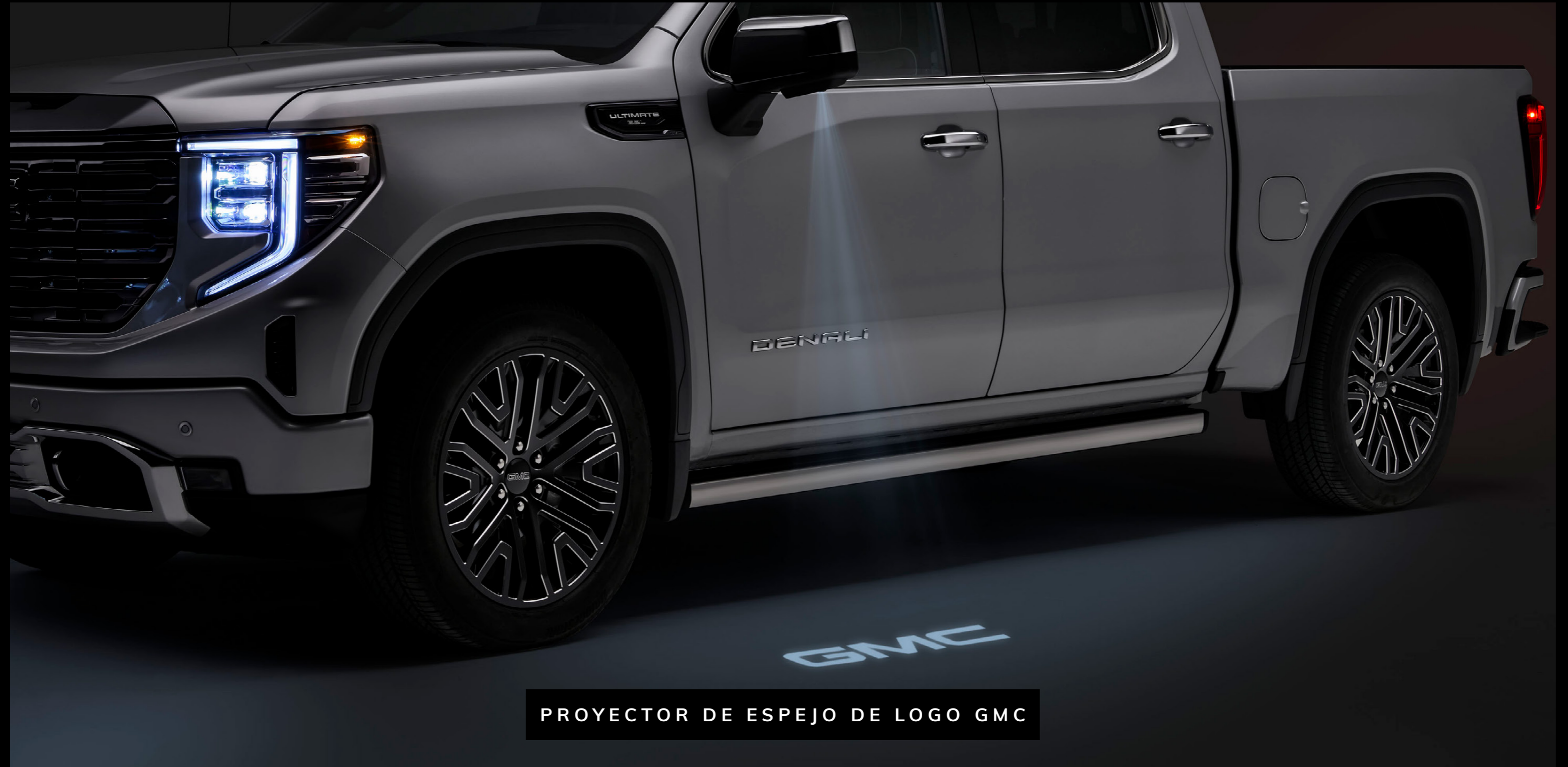
PROYECTOR DE ESPEJO DE LOGO GMC