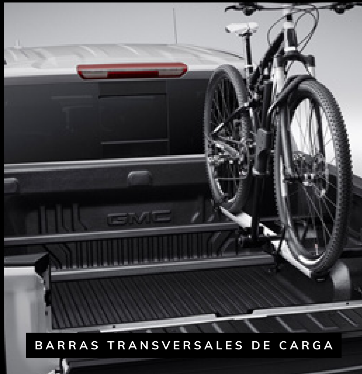
BARRAS TRANSVERSALES DE CARGA