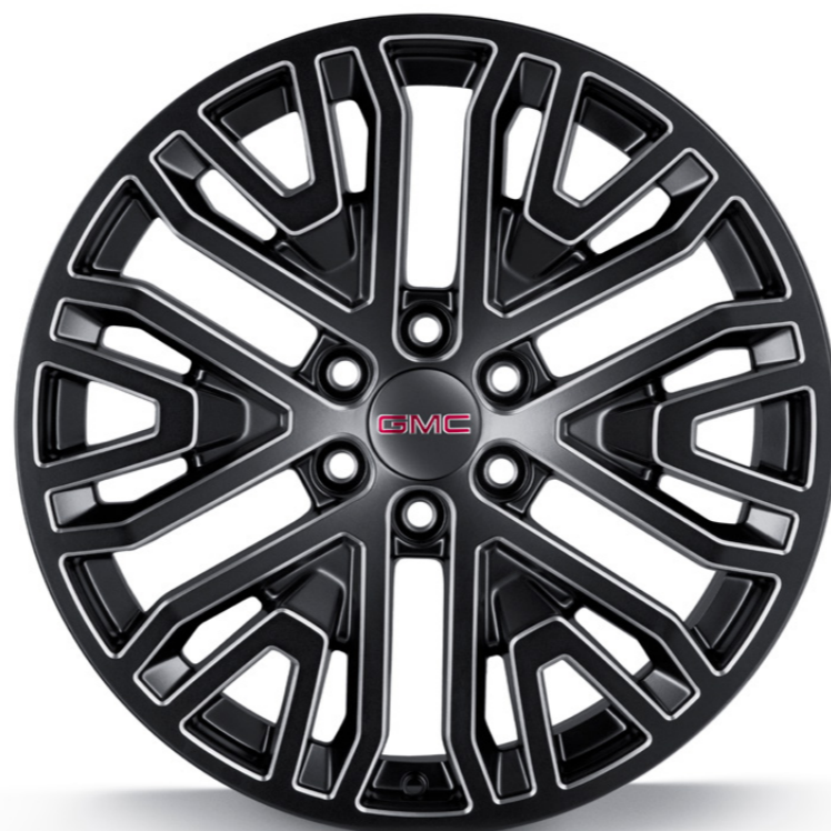
RIN DE ALUMINIO 22" EN NEGRO CON DETALLES CROMADOS DE 6 BRAZOS